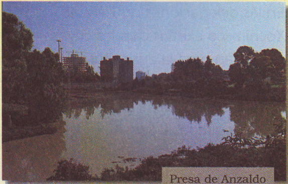
Presa de Anzaldo